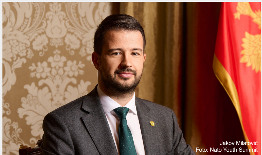
Jakov Milatović

Predsjednik Crne Gore Jakov Milatović podnio je 31. marta Ustavnom sudu predlog za ocjenu ustavnosti člana 15 Zakona o Ustavnom sudu, ukazujući da ta odredba omogućava da sudija, nakon isteka Ustavom propisanog mandata od 12 godina, nastavi da obavlja funkciju do izbora novog sudije, a najduže do godinu dana, te da to nije u skladu sa najvišim pravnim aktom.